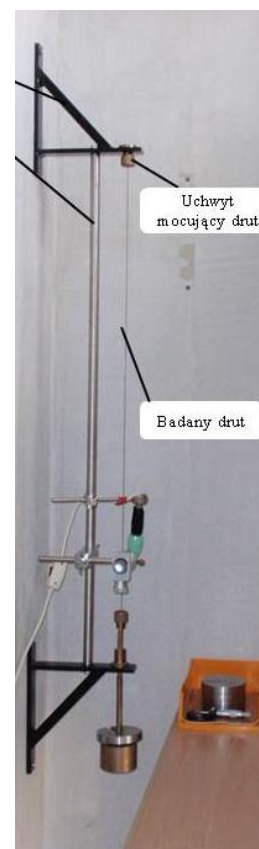
Rys.2. Stanowisko pomiarowe