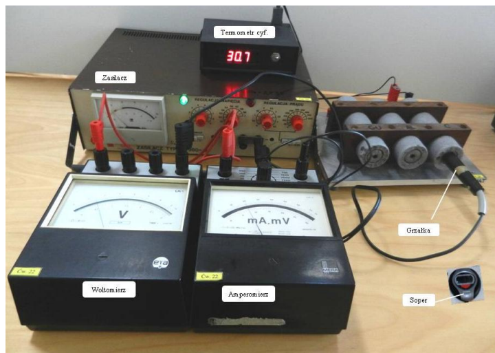
Rys. 2. Stanowisko pomiarowe

e) analogiczne pomiary wykonać dla drugiej próbki.