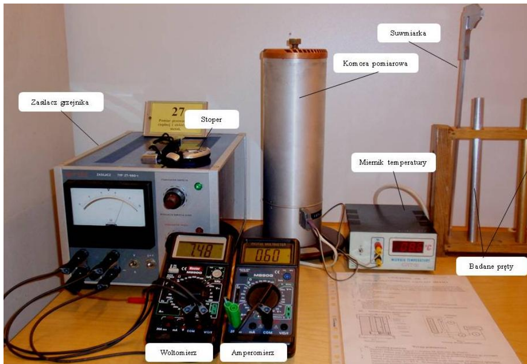
Rys.3. Stanowisko pomiarowe