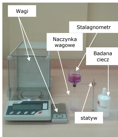
Rys.2. Stanowisko pomiarowe.

Prezentacja tworzenia się kropli na końcówce kapilary stalagmometru. O momencie oderwania się kropli decyduje siła ciężkości jak i siły napięcia powierzchniowego, których wartość zależy między innymi od średnicy kapilary.