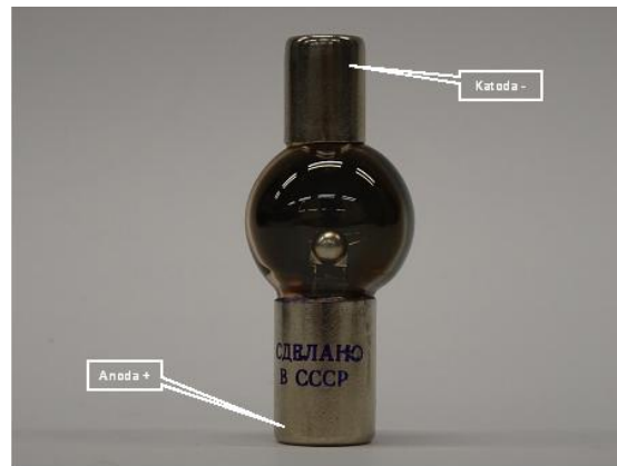
Rys. 3. Fotokomórka wyprodukowana w ZSRR.

Na rys. 3 przedstawiono typową fotokomórkę produkowaną w ZSRR w latach 70-tych ub. wieku.